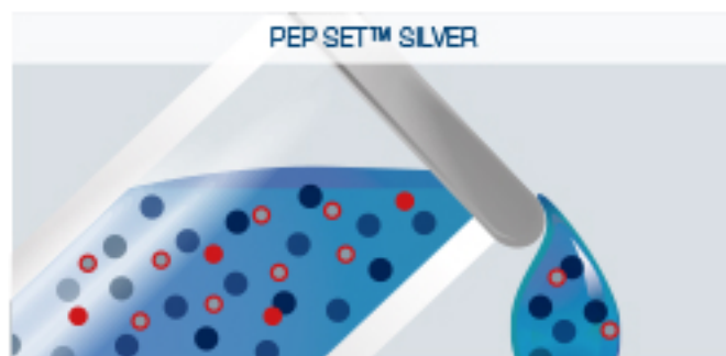
PEP SET™ SILVER